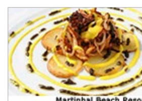
Martinhal Beach Resort

02-02-2015 (00h06) O operador Solférias tem a partir de hoje à venda uma Super Flash Sales Algarve com descontos entre 20% e 65% para estadas, desde escapas de duas noites a sete noites no Verão, em 24 unidades de alojamento turístico.