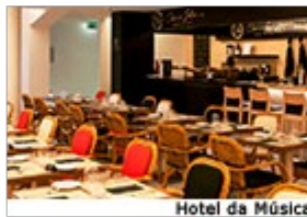
Hotel da Música

27-01-2015 (21h15) O hotel vinico The Yeatman tem um programa para grupos de quatro a oito pessoas que inclui meio dia no Caudalie Vinotherapie Spa com exercício e relaxamento, seguido de um almoço no restaurante do hotel.