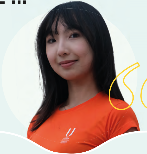
Yihuang Facultad de Bellas-Artes

Elegí venir a estudiar a Lisboa principalmente porque la atmósfera artística de la ciudad me atrajo profundamente. Durante mi máster, visité Lisboa varias veces y en cada una de ellas quedé encantada con su encanto único.