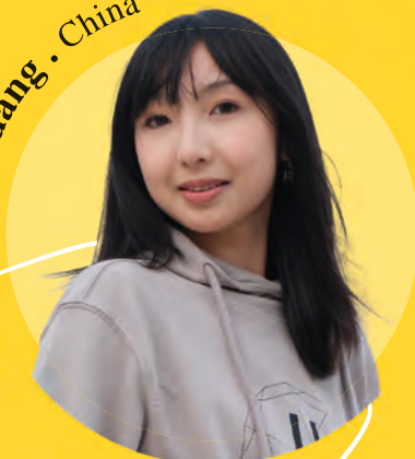
Yihuang · China