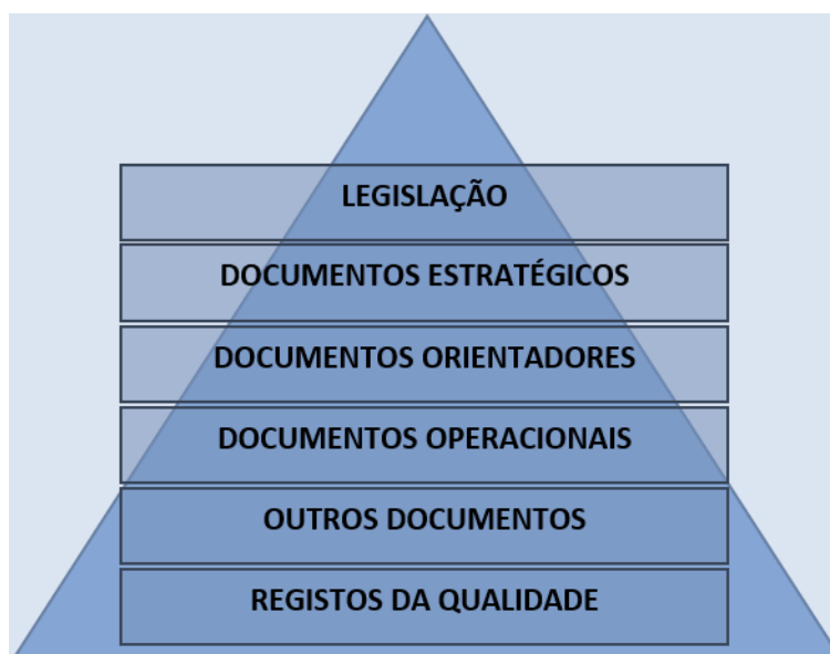
Figura 2 – Arquitetura documental do SIGQ-ULisboa

A legislação mais relevante foi referida anteriormente (Quadro 3).