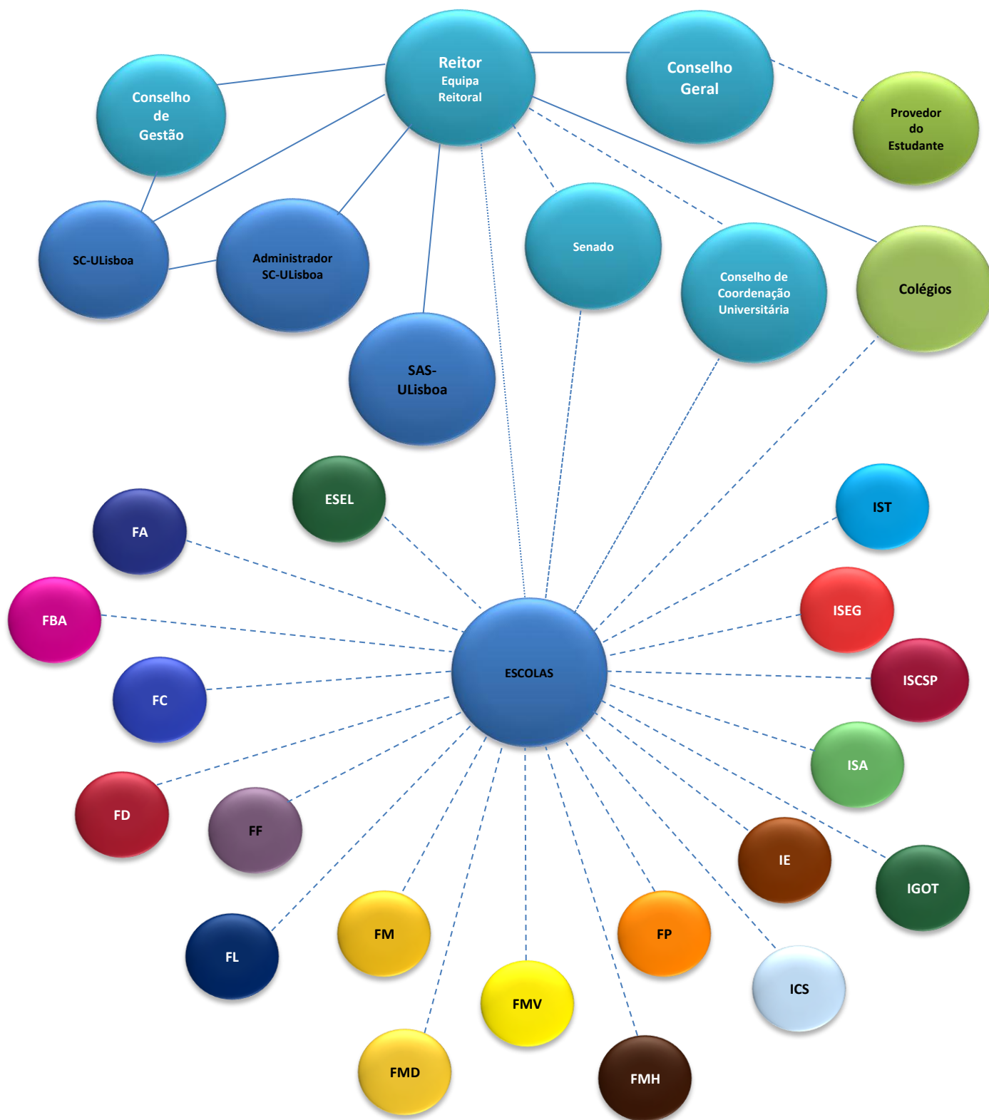
Figura 1 – Organograma da ULisboa